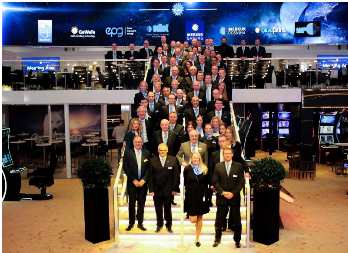
Bild: Das Team der Gauselmann Gruppe