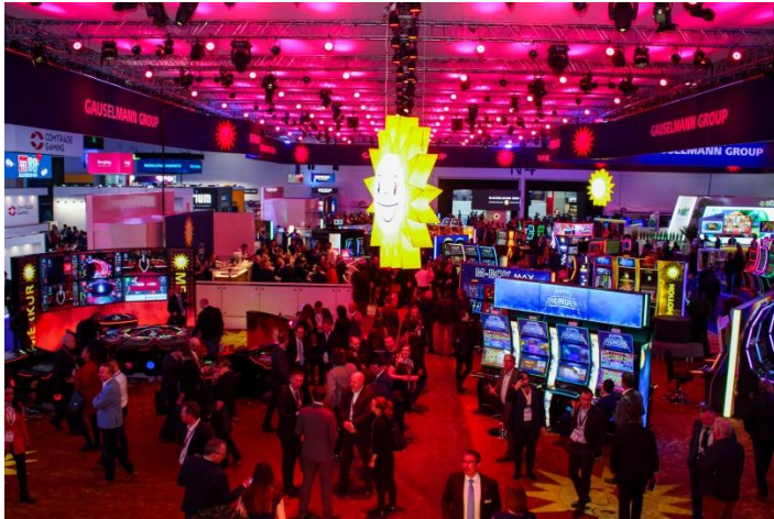
Bild: Der Messestand der Gauselmann Gruppe auf der ICE London 2020

Neben Merkur Gaming, adp und GeWeTe heißen der britische Multiplattform-Entwickler Blueprint Gaming, das spanische Entwicklungs- und Vertriebsunternehmen Merkur Dosniha, der Online-Gaming-Plattformanbieter edict egaming sowie der Zahlungsdienstleister EPG die Besucherinnen und Besucher auf dem ICE-Messestand der Gauselmann Gruppe willkommen.